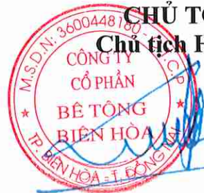
Trần Quốc Lập